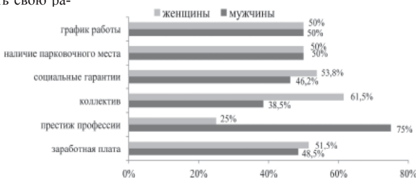
Рис. 2. Критерии выбора работы