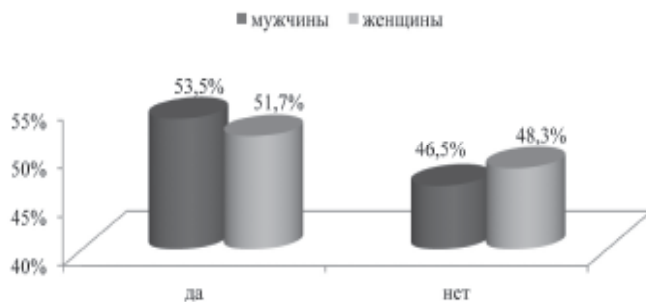
Рис. 5. Готовность работать сверхурочно

Довольно интересную картину показывают результаты следующего опроса. Большинство женщин и мужчин готовы работать сверхурочно (51,7 % и 53,5 %), тогда как процент ответивших «нет» немного ниже как у мужчин, так и у женщин (46,5 и 48,3 %) (рис. 5).