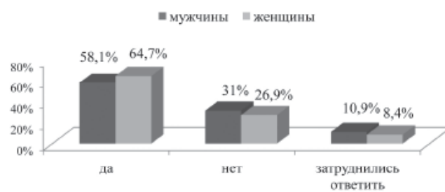
Рис. 1. Ответы на вопрос: «Устраивает ли Вас ваша работа в настоящее время?»

Как показало исследование, большинство мужчин готовы поменять место жительства ради хорошо оплачиваемой работы (38%). Каждая третья женщина скорее откажется от работы, чем поменяет место жительства, однако каждая четвертая согласится (30,8 и 27,5%). Вариант «скорее да, чем нет» выбрала каждая пятая респондентка (21,7%). Примерно равное количество мужчин выбрали варианты «скорее да, чем нет» и «скорее нет, чем да» (28,7 и 25,6%). Полностью откажутся от хорошо оплачиваемой работы, не желая менять место жительства, 6,2% мужчин и 14,2% женщин (рис. 4).