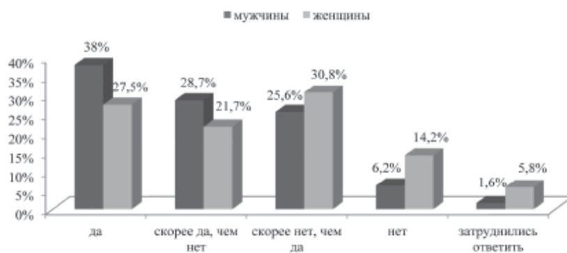
Рис. 4. Готовность поменять место жительства ради хорошо оплачиваемой работы

Довольно интересную картину показывают результаты следующего опроса. Большинство женщин и мужчин готовы работать сверхурочно (51,7 % и 53,5 %), тогда как процент ответивших «нет» немного ниже как у мужчин, так и у женщин (46,5 и 48,3 %) (рис. 5).