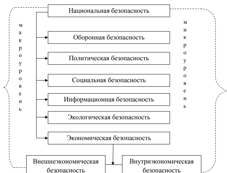
Рис. 1. Внешнеэкономическая безопасность в структуре национальной безопасности [2, с. 15]

Как видно в таблице 1, ВВП России по покупательной способности в 2021–2022 гг. составил 4785 и 5327 млрд долл. соответственно. В 2022 г. Российская Федерация по уровню ВВП поднялась на пятое место, что свидетельствует об экономической безопасности страны, несмотря на многочисленные санкции со стороны западных стран экономика России продемонстрировала рост.