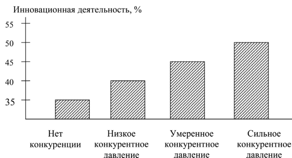
Рис. 1. Инновационная деятельность и конкуренция [7]

Важнейшим фактором поступательного развития экономики, повышения её конкурентоспособности в современном обществе является организация и