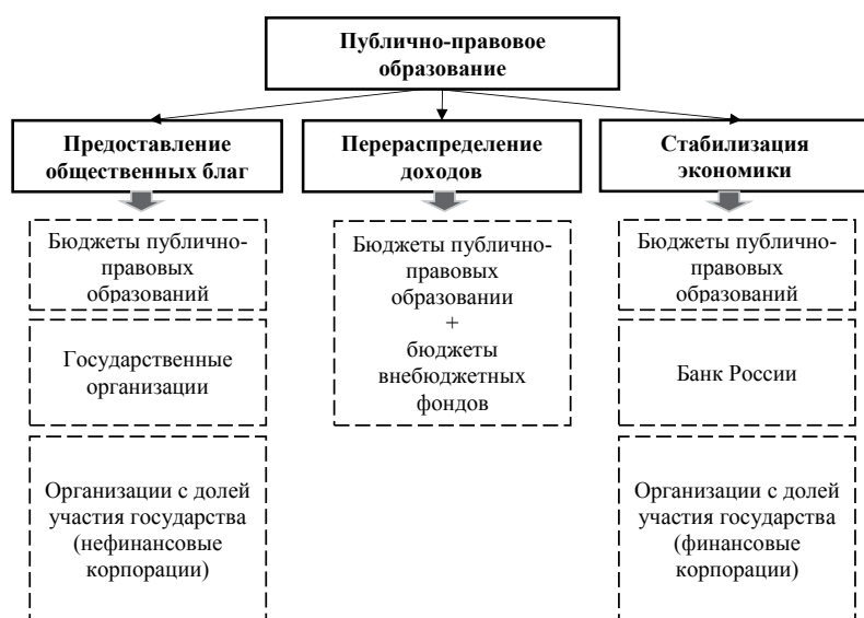
Рис. 2. Роль государственного (муниципального) сектора в экономике

2) бюджетных и автономных учреждений, связанным с причинением вреда гражданам, при недостаточности имущества у учреждений, на которое в соответствии с законодательством может быть обращено взыскание;