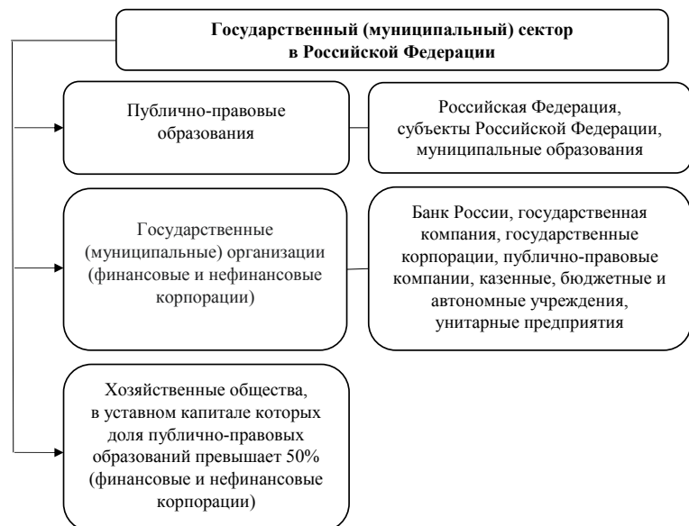
Рис. 1. Государственный (муниципальный) сектор в РФ