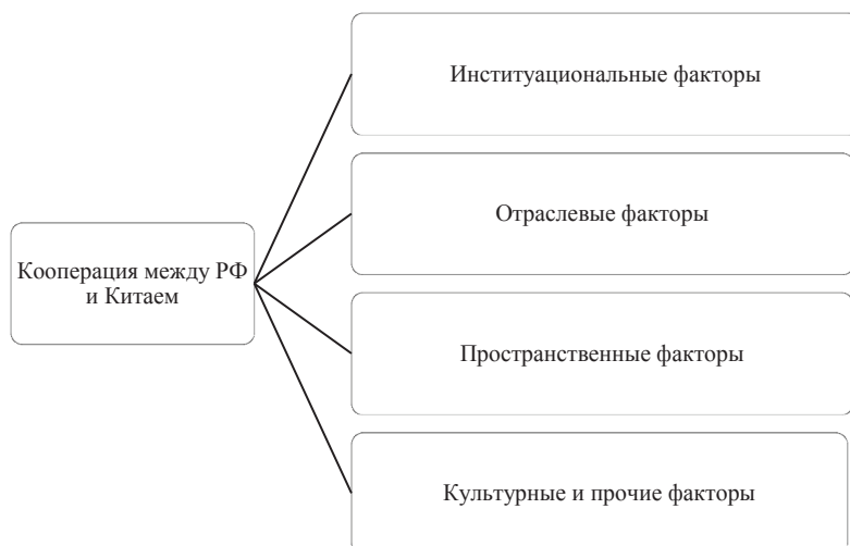
Рис. 1. Ключевые условия кооперации РФ и Китая в высокотехнологичных отраслях промышленности (составлено автором)

Обращаясь к каждому из факторов, была осуществлена характеристика каждого из них.