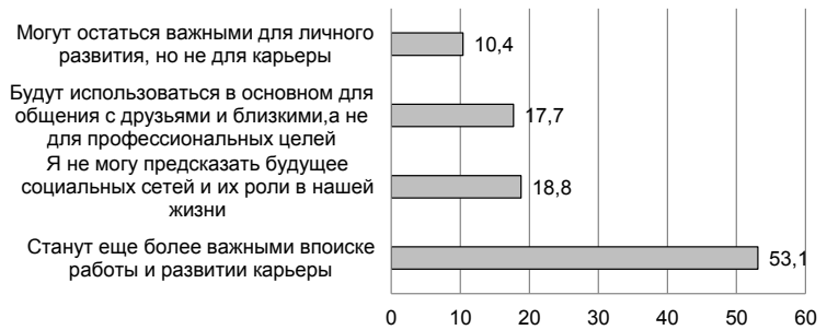
Рис. 1. Ответы на вопрос: «Какую роль социальных сетей вы видите в будущем для построения карьеры и личного развития?»

Помимо вышеперечисленного были даны свои варианты ответов: «социальные сети помогают ис-