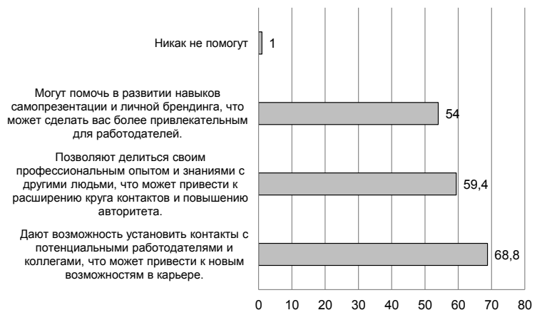
Рис. 4. Ответы на вопрос: «Как социальные сети могут помочь в построении карьеры?»

ключительно в общении с коллегами по работе, но никак не для получения новых знаний», «это боль-