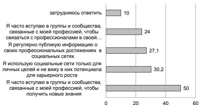
Рис. 3. Ответы на вопрос: «Как вы используете социальные сети в своей карьере и личном развитии?»