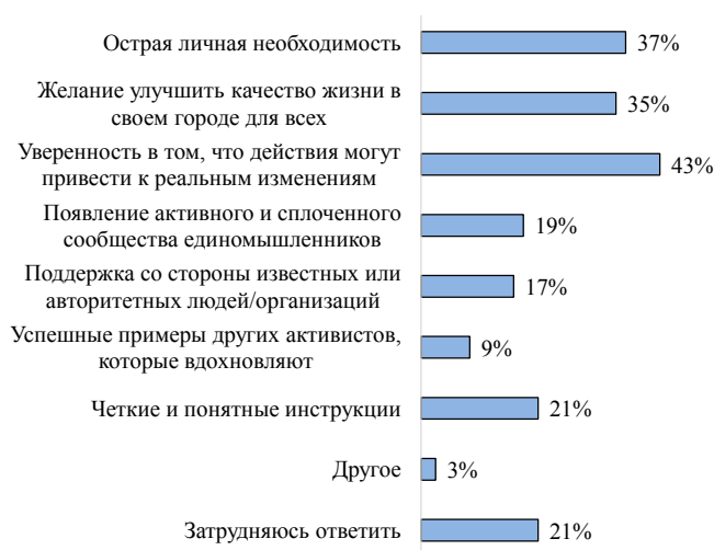
Рис. 2. Факторы, стимулирующие вовлечение студенческой молодежи в городской активизм

Говоря о побудительных мотивах городского активизма у студенческой молодежи, важно отметить, что определяющим мотивом для большинства опрошенных является уверенность в том, что их голоса и действия могут привести к реальным изменениям. На это указали 43 % респондентов. Также, по полученным данным, побудить молодое поколение заниматься решением городских проблем может острая личная необходимость в ситуациях, когда возникающая проблема затрагивает респондента или его семью напрямую (37 %), желание улучшить качество жизни в своем городе для всех (35 %), наличие четких и понятных инструкций, с чего начать деятельность (21 %), появление активного и сплоченного сообщества единомышленников (19 %) (рис. 2).