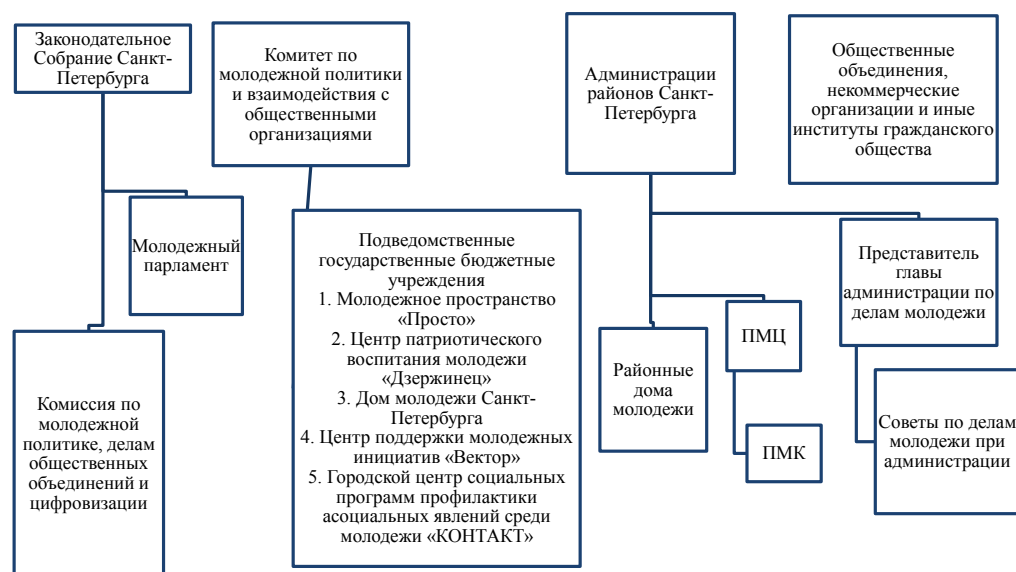
Рис. 1. Структура государственных органов и учреждений по делам молодежи в Санкт-Петербурге

Целью регионального проекта «Мы вместе (Вос-